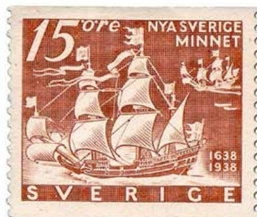
Frimärket som gavs ut till 300-årsminnet av Sveriges koloni i Amerika.