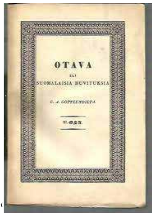
C.A. Gottlunds Otawa finns nu i biblioteket i Finnskogsmuseet i Skräddrabo.

Prenumeranterna utgör två tydliga och från varandra åtskilda grupper. I Finland, Ryssland och Sverige utom Värmland utgörs köparna helt övervägande av