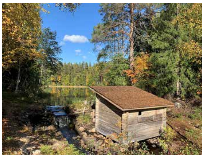
Nu står skvaltkvarnen i Bollnäs Finnskog många år till med nytt fint spåntak.

Själva namnet Oklagård har Anders fått av gamla namnet Okklabo från 1300 talet, som blev till Ockelbo så småningom. På marken vid Oklagård så har man hittat slagg från en gammal framställningsplats av järn, men även grunden av en ria och en kolbotten, mycket gamla kulturspår på denna plats, alltså. Hela den kringbyggda gården har byggts upp från början av 1977, då det fanns bara skog här. Vilket fantastiskt engagemang och av en mycket kunnig och intresserad kulturarbetare.