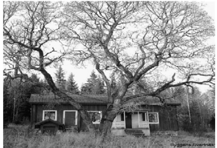
Jag vet inte vem som är fotograf men bilden ovan ska vara från 1956 och värdrädet står ännu starkt men 2014 bilden nedan, min bild, har det fallit.

sedan en riskabel backning ut därifrån - det finns en stor stenbumling i vägen, som gjord att köra bort avgasrör mot. När mitt hjärta åter satt på plats efter sin lilla utfärd till halsgropen svängde vi iväg mot Gruvberget, trodde vi. Det var visserligen med igenkännandets glädje jag återsåg Daldockan i Nilslarsberg, men det var nu inte dit vi skulle. Det blev till att göra en koves och vända i rätt riktning glada att varken vildsvin eller varg varit synliga.