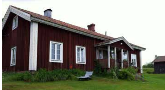
Den gamla rökstugan i Mattila, nedbrunnen men återuppbyggd.

Innan årsmötet på söndag blir det föreläsningar bland annat om hur det finska språket hölls levande i trakten, och om det skogsfinska DNA projektet. Efter lunch kan de som vill följa med på en tur med egna bilar upp till Abborrtjärnsberg.