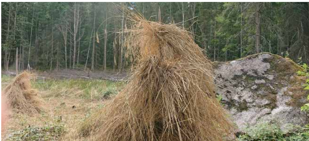
Svedjerågen står kvar på sina krakar på svedjan vid Linnés Hammarby i augusti 2020.